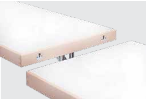
Einhängeplatten intermediate table tops

höhenverstellbarer Gleiter height-adjustable glider