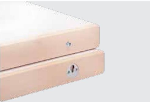
Verbindung Einhängeplatten connection of intermediate table tops