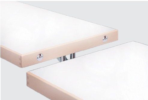
Einhängeplatten intermediate table tops

höhenverstellbarer Gleiter height-adjustable glider