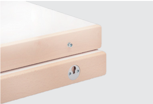
Verbindung Eihängeplatten connection of intermediate table tops