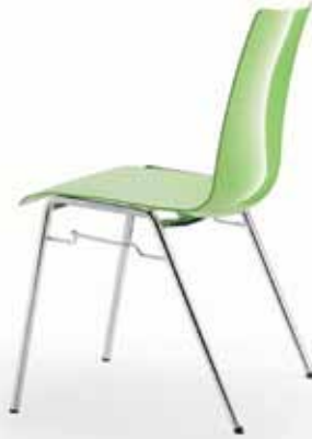
Schilfgrün reed green