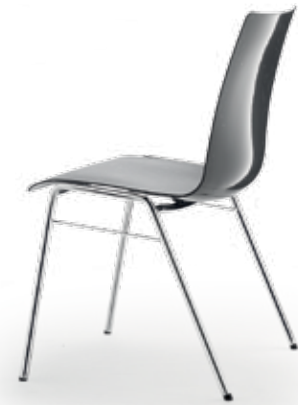
Schiefergrau slate grey

Ungepolstert · not upholstered Sitzpolster · seat upholstered