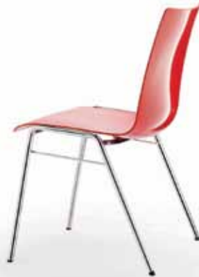
Signalrot signal red