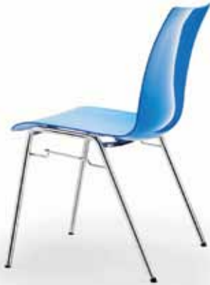
Himmelblau sky blue