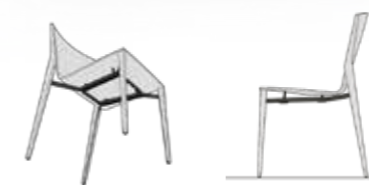
Stuhl ohne Armlehnen ungepolstert | mit Vorpolyster Preis: ab EUR 906, - chair without armrests not upholstered | fully upholstered front price: from EUR 906, -