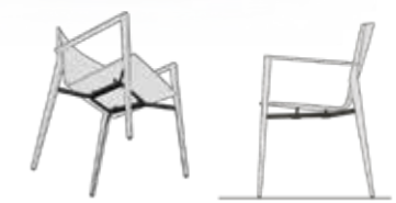
Stuhl mit Armlehnen ungepolstert | mit Vorpolyster Preis: ab EUR 906, - chair with armrests not upholstered | fully upholstered front price: from EUR 906, -