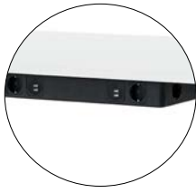
PB_F42* große Netbox netbox large