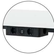
PB_B41* kleine Netbox netbox small