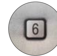
numéro de place