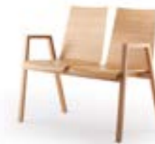
PAN 392|393 BANC 2 PLACES STRUCTURE EN BOIS MASSIF | COQUE EN BOIS