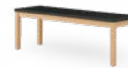
PAN 3900 BANQUE