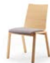
PAN 390|391 CHAISE EMPILABLE EN LIGNE | DOSSIER HAUT STRUCTURE EN BOIS MASSIF | CONTI RRAGE