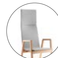
Bol 397 Hauteur totale 1 250 mm