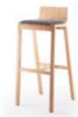
PAN 394 TABOURET DE BAR STRUCTURE EN BOIS MASSIF | COQUE EN BOIS