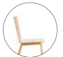
Bol 392 Hauteur totale 860 mm