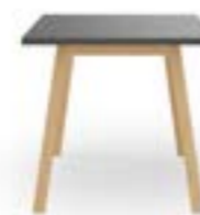
PAN 3910 TABLE À QUATRE PIEDS