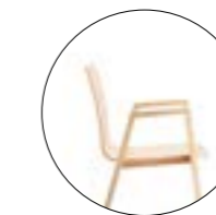
Bol 390 Hauteur totale 830 mm