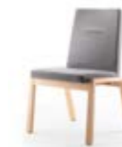
PAN 398|399 CHAISE EMPILABLE EN RANGÉE | CHAISE POUR CHARGES LOURDES STRUCTURE EN BOIS MASSIF | ENTIÈREMENT REMBOURRÉ