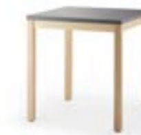
PAN 3900 TABLE À QUATRE PIEDS