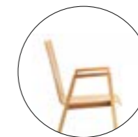
Bol 391 Hauteur totale 860 mm