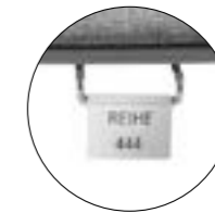
Écran en série