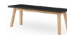
PAN 3910 BANQUE