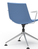
BLAQ 479 KONFERENZSTUHL ALUMINIUM-FUSSKREUZ | KUNSTSTOFFSCHALE