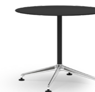
BLAQ 470 BISTROTISCH ALUMINIUM-FUSSKREUZ | MITTELSÄULENTISCH