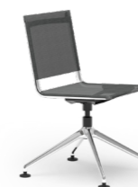
BLAQ 474 KONFERENZSTUHL ALUMINIUM-FUSSKREUZ | NETZSCHALE