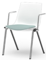
BLAQ 468 STAPEL-REIHENSTUHL STAHLROHRGESTELL | KUNSTSTOFFSCHALE