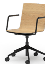
BLAQ 476 DREHSTUHL ALUMINIUM-5ER FUSSKREUZ | HOLZSCHALE