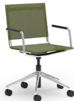
BLAQ 472 DREHSTUHL ALUMINIUM-5ER FUSSKREUZ | NETZSCHALE