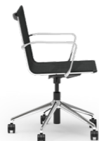
BLAQ 470 DREHSTUHL ALUMINIUM-5ER FUSSKREUZ | NETZSCHALE