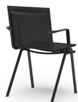
BLAQ 460 | 462 STAPEL-REIHENSTUHL STAHLROHRGESTELL | NETZSCHALE