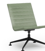
BLAQ 475 LOUNGESESSL ALUMINIUM-FUSSKREUZ | VOLLPOLSTERSCHALE