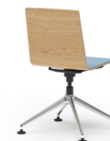
BLAQ 477 KONFERENZSTUHL ALUMINIUM-FUSSKREUZ | HOLZSCHALE