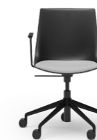
BLAQ 478 DREHSTUHL ALUMINIUM-5ER FUSSKREUZ | KUNSTSTOFFSCHALE