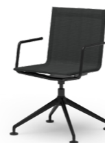
BLAQ 473 KONFERENZSTUHL ALUMINIUM-FUSSKREUZ | NETZSCHALE