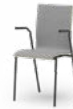
ATICON 734 | 744 STAPELSTUHL STAHLROHRGESTELL | HOLZSCHALE