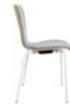
ATICON 746 STAPELSTUHL STAHLROHRGESTELL | HOLZSCHALE