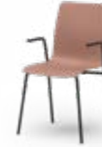
ATICON 751 STAPELSTUHL STAHLROHRGESTELL | HOLZSCHALE