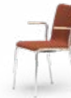
ATICON 165 STAPELSTUHL STAHLROHRGESTELL | HOLZSCHALE