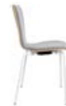
ATICON 746 STAPELSTUHL STAHLROHRGESTELL | HOLZSCHALE