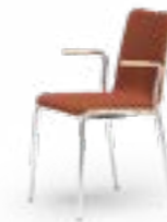
ATICON 165 STAPELSTUHL STAHLROHRGESTELL | HOLZSCHALE