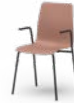
ATICON 751 STAPELSTUHL STAHLROHRGESTELL | HOLZSCHALE