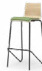
ATICON 28 STAPEL-BARHOCKER STAHLROHRGESTELL | HOLZSCHALE