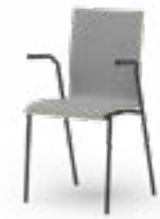
ATICON 734 | 744 STAPELSTUHL STAHLROHRGESTELL | HOLZSCHALE