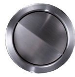
Aufsatzring 3 Schwingklappe