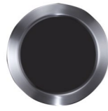
Aufsatzring 2 großer Einwurf