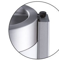
kipp- und abnehmbar Kettenverbinder als Diebstahlschutz