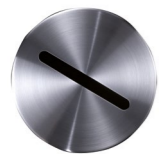
Aufsatzring 4 Diskretionsschlitz