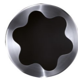
Aufsatzring 5 Schirmöffnung