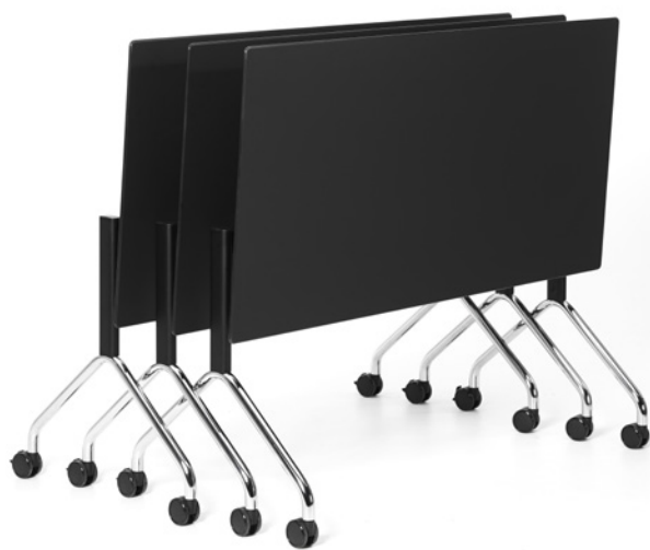
table height 740 – 750 mm