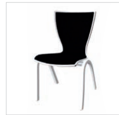
0pr 49 79D 00