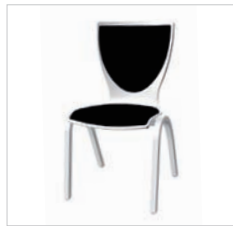
0pr 49 79 00