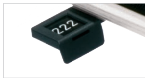
plha-001 | plnr-004