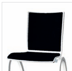
Sitz- und Rückenpolster Seat, backrest upholstered Assise et dossier garnis