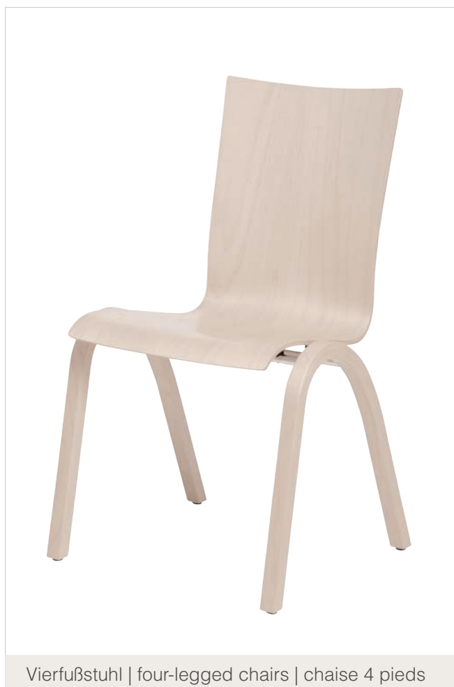
Vierfußstuhl | four-legged chairs | chaise 4 pieds