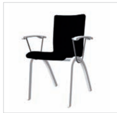
spr 49 40V 49