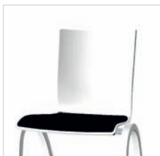
Sitzpolster Seat upholstered Assise garnie