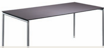
Tische, Klappische | tables, folding tables