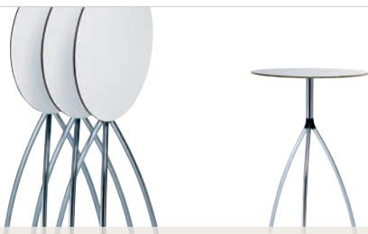
Stehische | stand-up tables