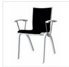
spr 49 40D 49