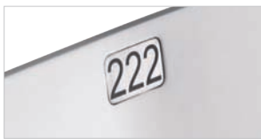
plnr-007 ungepolstert plnr-007 without upholstery plnr-007 non garni