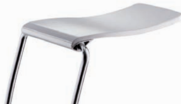
Barhocker | barstools