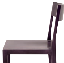
Holzstühle | wooden chairs