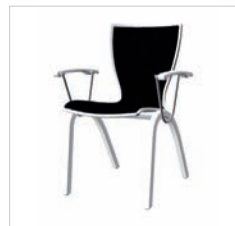
spr 49 79D 49