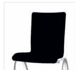
Vollpolster Fully upholstered Garnissage complet