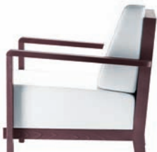
Polstermöbel | upholstered furniture