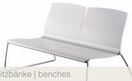
Sitzbänke | benches