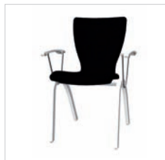
spr 49 79V 49