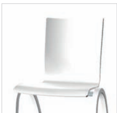
Ungepolstert Without upholstery Non garni