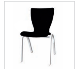
0pr 49 79V 00