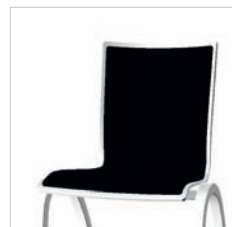
Durchgehendes Polster Fully upholstered Garnissage continu