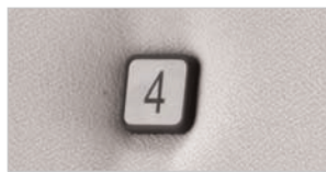
plnr-008 Rückenpolster plnr-008 backrest upholstered plnr-008 dossier garni