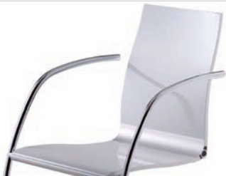
Stahlrohrstühle | steel tube chairs