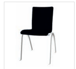
0pr 49 40V 00