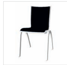
0pr 49 40D 00