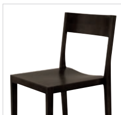
Ungepolstert Without upholstery Non garni