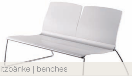
Sitzbänke | benches