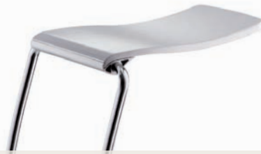
Barhocker | barstools