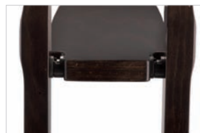
Buchablage | book basket | range-livres