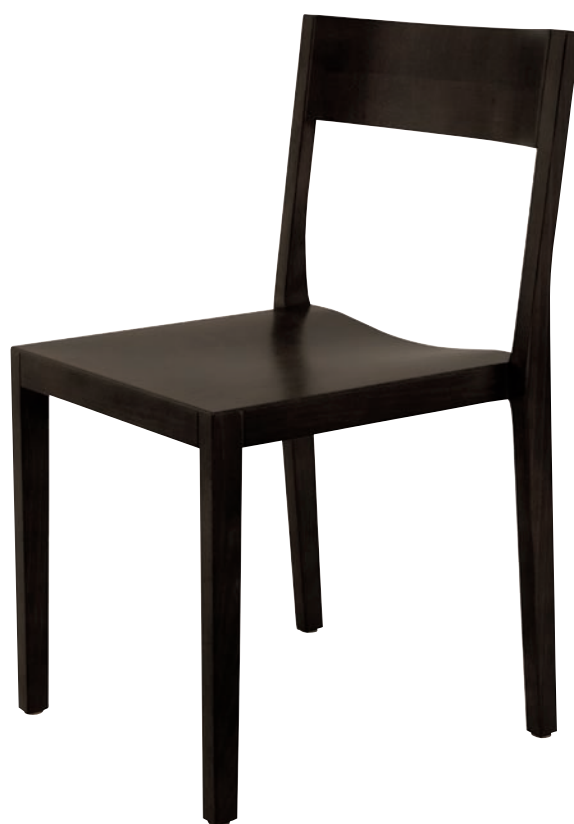
Vierfußstuhl | four-legged chairs | chaise 4 pieds