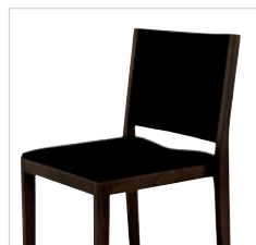
Sitz- und Rückenpolster Seat and backrest upholstered Assise et dossier garnis