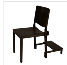
Kniebank | kneel rest | agenouilloir