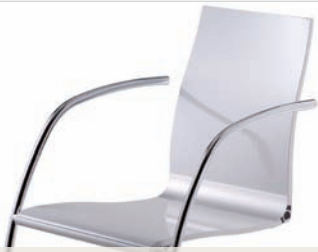
Stahlrohrstühle | steel tube chairs