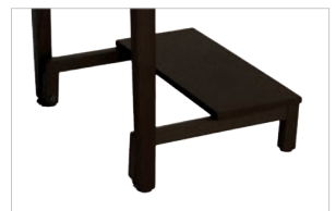
Kniebank | kneel rest | agenouilloir