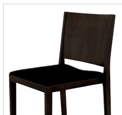
Sitzpolster Seat upholstered Assise garnie