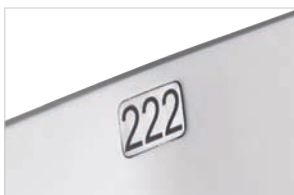
plnr-007 ungepolstert plnr-007 without upholstery plnr-007 non garni