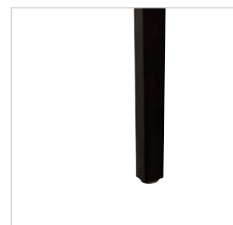
Polyamid-Gleiter Polyamide glider Patins en polyamide